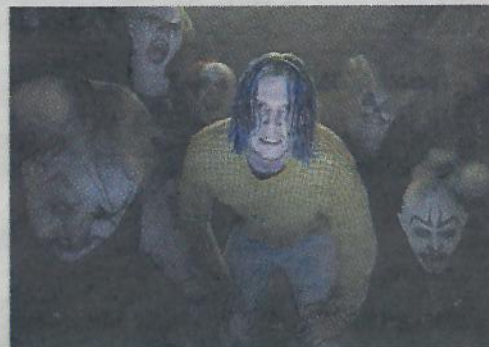
Evan Peters in American Horror Story: Cult

1924 → In Italia va in onda la prima trasmissione radiofonica: è un concerto di musica classica